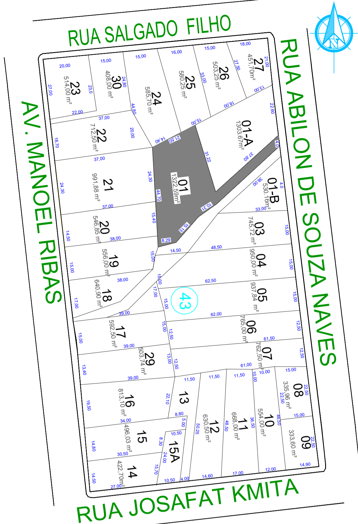
ARQ 01/07 PLANTA - LOCALIZAÇÃO ESCALA 1/500

DETALHAMENTO VIGAS CINTA CA50-4 ø8.0 C=VAR. 30 26 15 11 CA60-ø5.0 C/15CM C=84