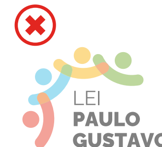
Não alterar a opacidade