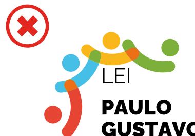
Não desalinhar os elementos