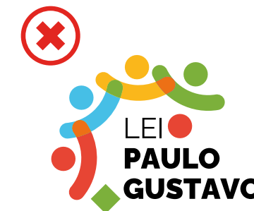
Não inserir elementos não previstos