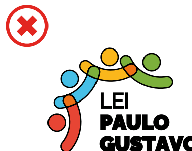
Não utilizar contornos